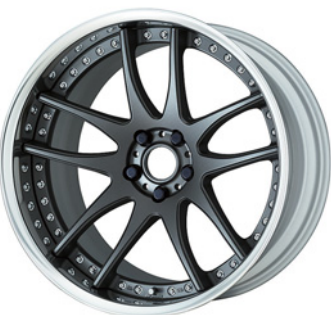
マットカーボン (MGM) (ディープコンケイブ) 20