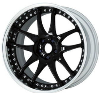
ブラック (B) (セミコンケイブ) 20