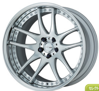
パーニングシルバー (BS) (ディープコンケイブ) (FLAT TYPE シルバーキャップ) 20